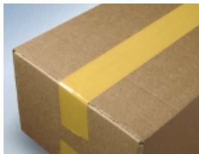
Auf den ersten Blick ersichtlich: sicher verschlossene Lieferung mit dem tesa 64007 Sicherheitsverschlussband.

So lassen sich Schwachstellen in der Logistikkette direkt ausmachen und entsprechende Maßnahmen können ergriffen werden.