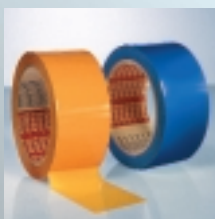
tesa 64007 Die Sicherheits- verschluss bänder

Geeignet für Kartonagen jeder Art und Größe: