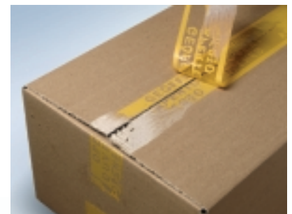
Beim Abziehen des Bandes erscheint der Schriftzug »GEÖFFNET«, der auch beim Wiederverschließen deutlich sichtbar bleibt.