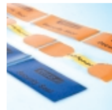
tesa 64010 Das Sicherheits- etikett

Passend für kleine und mittelgroße Kartonverpackungen sowie wiederverwertbare Transportcontainer: