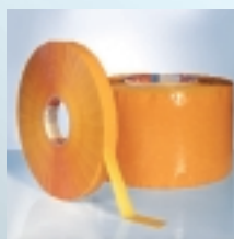
tesa 64009 Das Sicherheits- verschluss- band

Ideal für Folienverpackungen (z.B. Umschläge, Taschen):